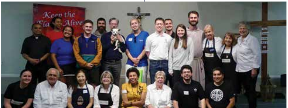
Voluntarios de la Catedral sirviendo a los Peregrinos Perpetuos del Oeste el 22 de mayo cuando la peregrinación del Camino de San Junípero Serra llegó a la Catedral.

Bajo la dirección del Sacristán de la Catedral, los sacristanes de la misa individual arreglan la mesa de credibilidad para la misa, alistan las oraciones en el misal romano para el sacerdote, preparan las vestiduras del sacerdote, revisan las baterías para el micrófono, preparan varios documentos como las intercesiones generales y los salmos para cantores y lectores, reparten hostias para la consagración y, en general, aseguranse de que la mesa de credenza y la mesa de las ofrendas estén colocadas