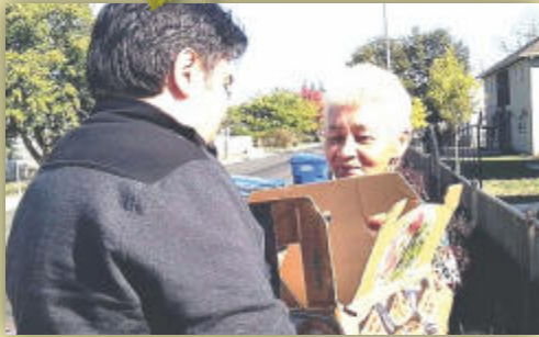
Front Door Ministry