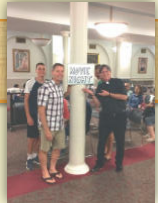
Cinema Divina Movie Night