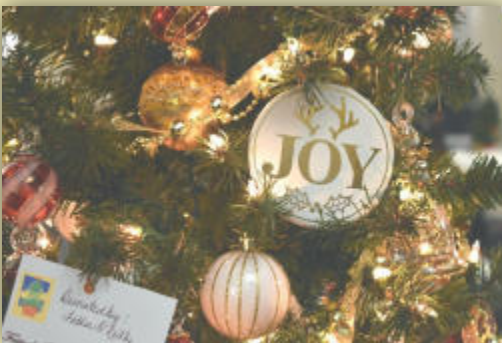
Festival of Trees and Lights